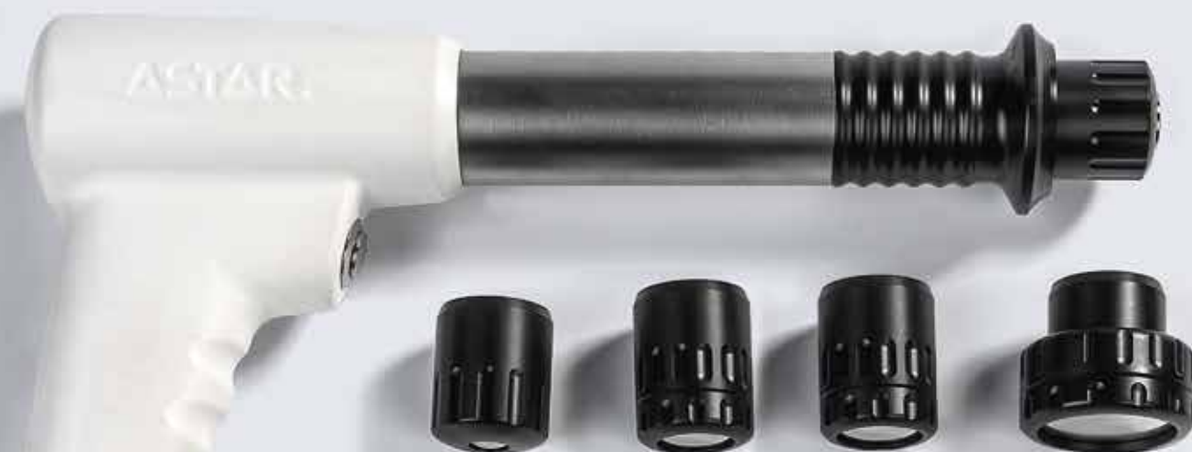
Transmisores con diámetros: 10, 15, 20 y 35 mm

Basándose en los más de 20 años de experiencia de Astar, se ha desarrollado un nuevo mejorado modelo del dispositivo de terapia de ondas de choque de la serie Impactis. El dispositivo Impactis M+ se ha diseñado pensando en soluciones aún más ergonómicas. Tiene todas las características del Impactis M, en el que han confiado miles de fisioterapeutas profesionales, y además cuenta con funciones adicionales para mejorar la comodidad del usuario y ampliar las capacidades terapéuticas del dispositivo.